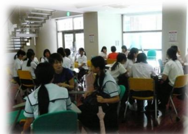
途中で椅子が足りなくなり、補充するほどでした。

県外からの参加や1年生の参加も多く、皆さんとても熱心に相談していました。ある母親は、「娘が医師になった場合、積極的に子育てに参加出来るのか？祖父母の手助けがなくても大丈夫なのか？つらい世界ではないのか？」と心配しておられ、子育て中の現役医師であるきらめきスタッフが実体験を話し、アドバイスしました。医療人になる前の学生達に医療現場の現実を周知することで、こういった悩みが少しでも軽減され、女性医師・歯科医師がキャリアを継続出来る環境が整えられる事を切に望みます。