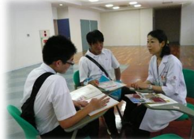
男子学生も熱心に相談をしています。